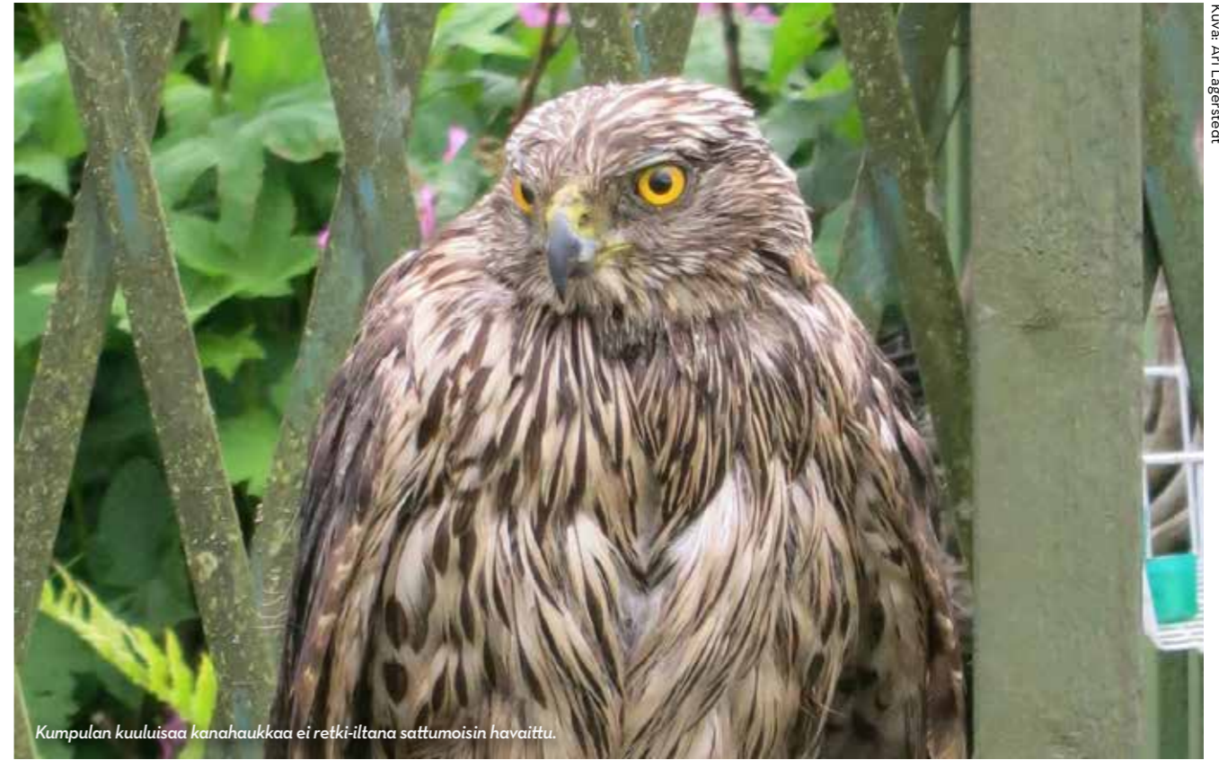
Kumpulan kuuluisaa kanahaukkaa ei retki-iltana sattumoisin havaittu.

Kaksi vapaaehtoista opasta veti toukokuun alussa siirtolapuutarhan alueella linturetken kiinnostuneille palstalaisille.